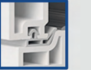
Isı, ses, toz ve suyu absorbe eden özel conta

Aesthetic appearance with double glazing bead