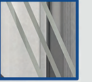
24, 32, 42 mm cam kalınlıkları