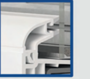
Estetik görünümlü çift cam çitası

Aesthetic appearance with double glazing bead